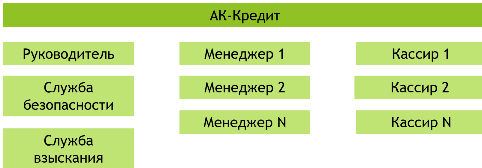
Схема лицензирования АК-Кредит